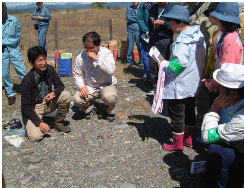
氏家大橋上流の河川敷で 播種前に東京大学保全生態学研究室の先生の話聞く。

喜連川から参加した親子は「草むしりは大変だけど、自分がまいた種が大きくなると思うと嬉しい。」「自然の保全活動に参加することは、気持ちがいいですね。」など、笑顔で話をしてくれました。